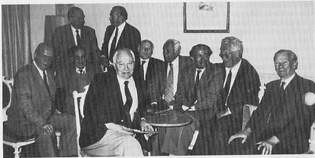
50 Jahre nach dem Abitur

Abend die persönlich vorgetragenen Lebensläufe ein, deren Besonderheiten immer wieder Anreiz zu einer zwanglosen Unterhaltung gaben.